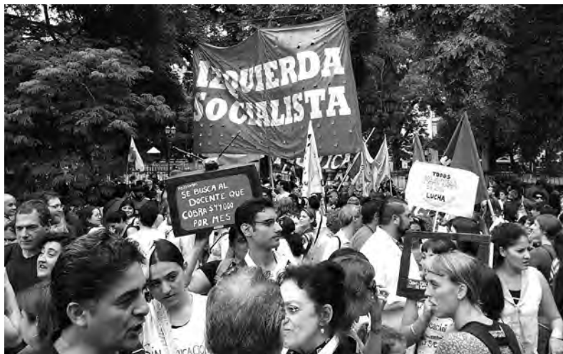
Desde hace décadas nuestra corriente viene planteando la necesidad de construir una herramienta política de independencia de clase que pelee por un gobierno de los trabajadores

Muchas veces los activistas con los que compartimos luchas en juntas internas, cuerpos de delegados, agrupaciones sindicales o estudiantiles nos plantean que no están convencidos de la necesidad de construir un partido revolucionario o que, incluso, en algunos casos, lo consideran contraproducente. Queremos responder a esos planteamientos.