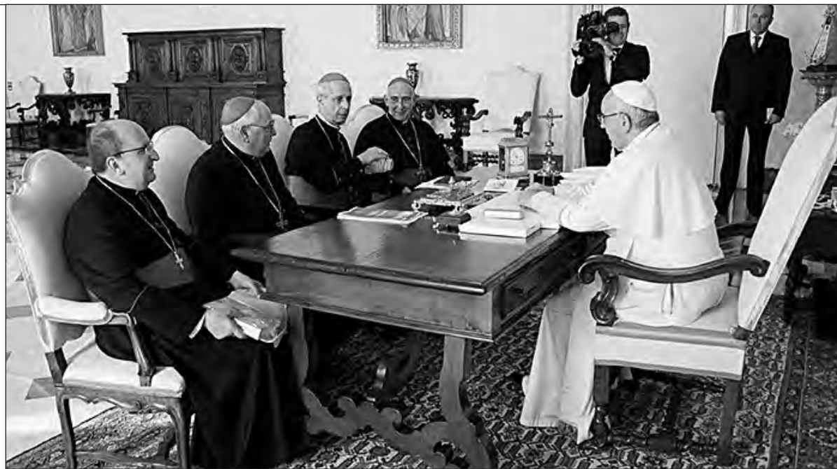
El Papa Francisco con los actuales jerarcas de la Iglesia Católica Argentina, la misma que bendecía a los genocidas

Adolfo Scilingo al confesar sus crímenes detalló que los capellanes de la ESMA lo hacían sentir mejor al darle una explicación y consentir