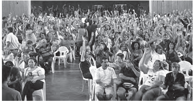
Hay que recuperar las asambleas en ATEN

Púrpura (POR), dos de la Rosa (trotskistas independientes), uno de la Negra (PTS), más los vocales suplentes provenientes de otras agrupaciones como la Ambar, la Naranja (Rompiendo Cadenas) y la Verde (PCR).