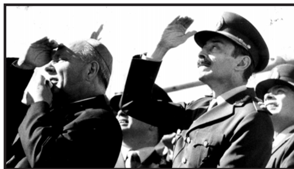
Videla con el ex cardenal Primatesta