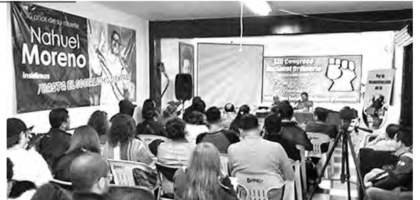
Vista del congreso de nuestro partido hermano de México

El MAS a su vez expresó estar comprometido “con la construcción del poder de la clase trabajadora y el pueblo pobre y oprimido, de los pueblos originarios que, sin duda,