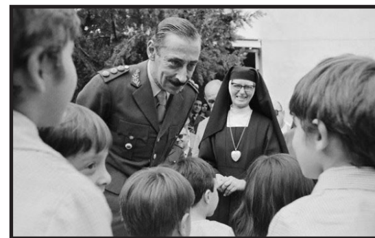
El dictador con niños y una monja sonriente

los vuelos de la muerte. La Armada hasta ese momento no contaba con ningún procedimiento para el destino final de los secuestrados y fue, según Scilingo, la jerarquía eclesiástica quien ideó los "vuelos de la muerte" como una "solución cristiana". Eran épocas donde el cardenal Raúl Primatesta afirmaba que "la Argentina ha sufrido un asalto marxista con intento de toma del poder y las fuerzas armadas se han resistido".