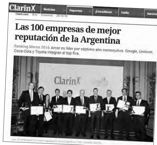
Noticia en la web de Clarin

de $2000. El cual ni lejanamente compensa el deterioro del salario real producido este año y no es obligatorio, por lo que podrá ser evadido por empresas grandes, medianas y pequeñas.