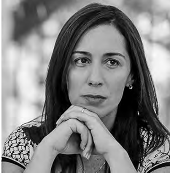
Vidal ni siquiera quiere pagar el bono miserable